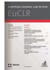
Table of Contents